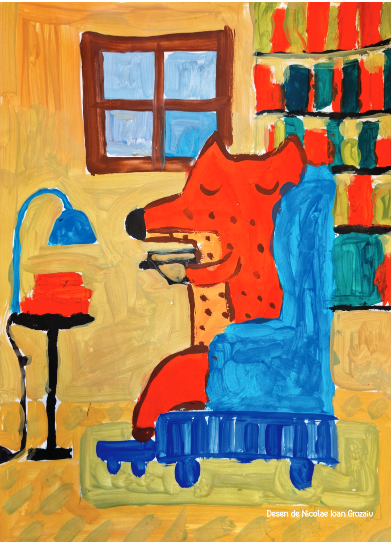
Desen de Nicolae Ioan Grozaiu